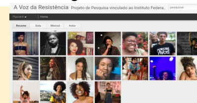
imagem 2: blog